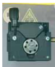
M20 - T21