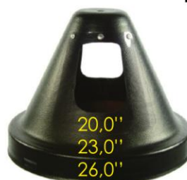
Redonda sin brida