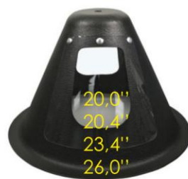
Redonda con brida